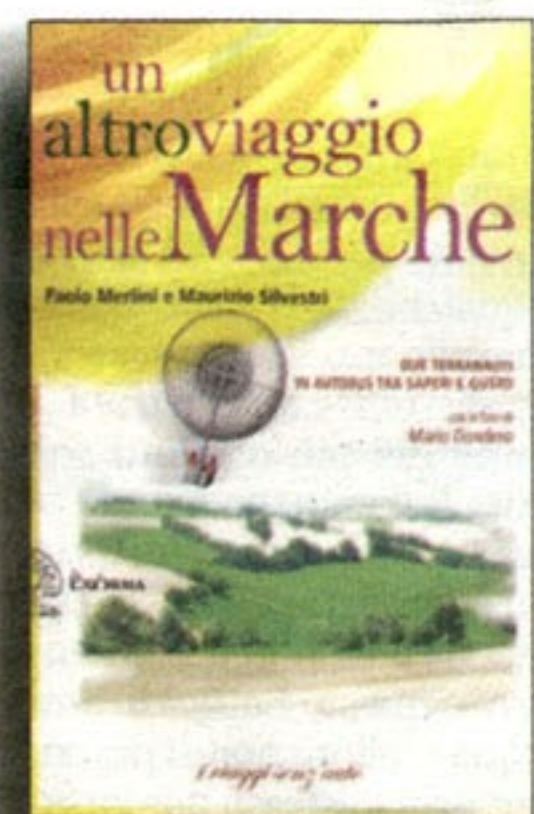
UN ALTRO VIAGGIO NELLE MARCHE