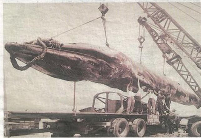
La balena Goliath